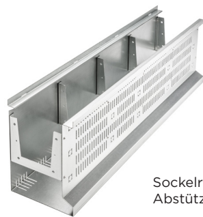
Sockelrinne mit seitlicher Abstützung